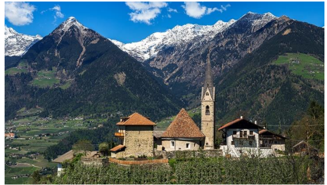
mit Rundkirche St. Georgen