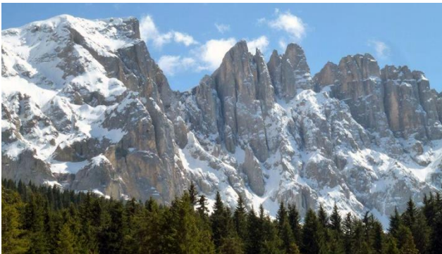
Latemar Gebirge in den Dolomiten