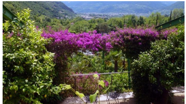
Gärten von Schloss Trauttmansdorff